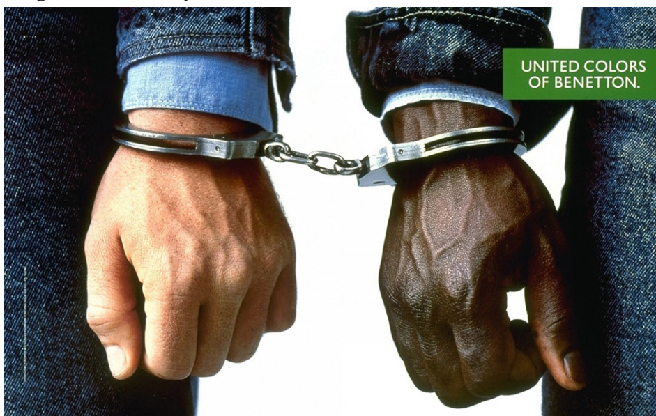
Figura 1. Cartel campaña Otoño-invierno 1989-1990 , United Colors of Benetton.

Fuente: Fotografía y concepto de Oliviero Toscani, Benetton, 1989.