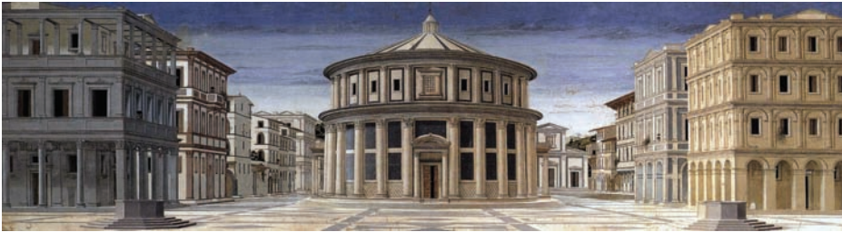
Ciudad ideal , Piero della Francesca, Témpera sobre madera, 239,5 cm × 67,5 cm. Galleria Nazionale delle Marche, Urbino (Italia), 1480-1490.